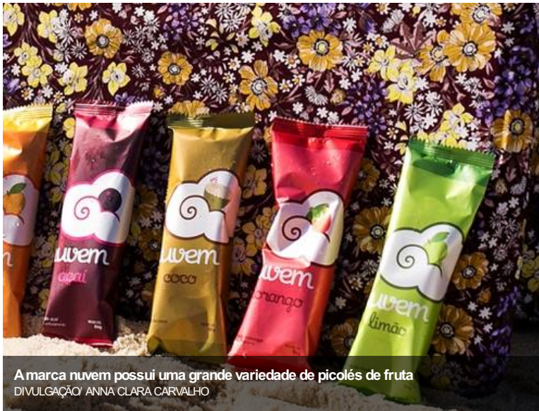
A marca nuvem possui uma grande variedade de picolés de fruta.